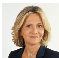
Valérie Péresse, Présidente d'Île-de-France Mobilités et de la Région Île-de-France

Plus que jamais, vous pouvez l'appeler l'Essonnien !