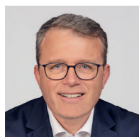
François Durovray, Président du Département de l'Essonne

L'État finance à 30% ce projet, soit 177,8 M€. Axe structurant du réseau de transport francilien, le T12 est un outil majeur de report modal de la voiture individuelle vers les transports en commun et contribue à réduire les émissions de dioxyde de carbone et la pollution de l'air. Avec un trajet de moins de 40 minutes entre Massy-Palaiseau et Évry-Courcouronnes, les deux pôles économiques majeurs de l'Essonne, il permet de renforcer l'attractivité de ce territoire en plein développement.